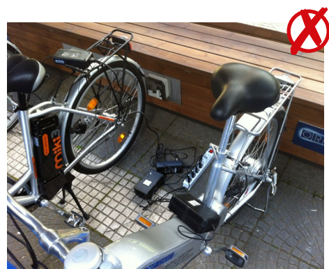
Abb. 18 Nicht empfehlenswert; Ladegeräte liegen auf dem Boden und sind über eine Mehrfachsteckdose unterverteilt (marktübliche Ladegeräte sind nur für die Benutzung in „trocknen Räumen“ geeignet)