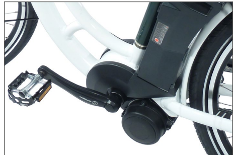
Abb. 5 Mittelmotor

Der Motor befindet sich im Bereich des Tretlagers. Die Lage des Schwerpunktes in der Mitte des Pedelec 25 ist für das Fahrverhalten im Vergleich zu den anderen Motoranordnungen von Vorteil.