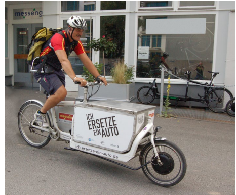
Abb. 15 Bei der Zustellung