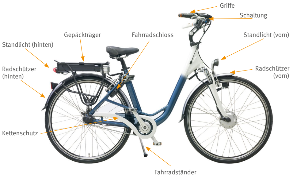
Abb. 9 Empfehlenswerte Zusatzausstattung des Pedelec 25