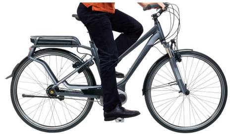
Abb. 14 Richtig eingestellte Sitzhöhe beim Tretvorgang

Die Einstellung der richtigen Sitzhöhe resultiert aus der Verstellung der jeweiligen Sattelhöhe. Die Sattelhöhe ist richtig eingestellt, wenn Sie – auf dem Sattel sitzend – mit den Fußballen beider Füße den Boden soeben erreichen können. Beim Tretvorgang selbst sollte das Bein im Kniegelenk nahezu vollständig gestreckt werden können. Die Sattelstütze darf maximal bis zu der jeweiligen umlaufenden Markierung herausgezogen werden. Hierbei ist die Mindesteinstecktiefe der Sattelstütze konsequent einzuhalten.