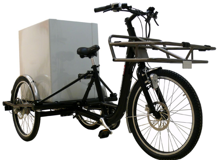
Abb. 3 Mehrspuriges Pedelec 25