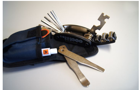
Abb. 11 Schrauben- und Inbusschlüsselset