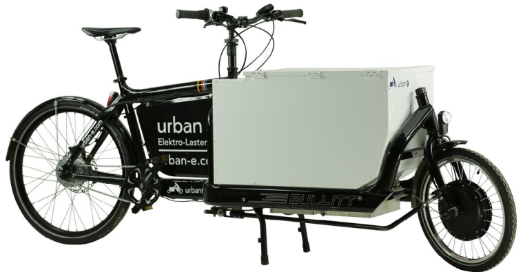
Abb. 2 Einspuriges Pedelec 25