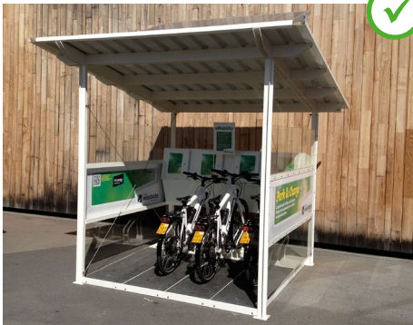
Abb. 17 Öffentliche Ladestation an einem Einkaufszentrum