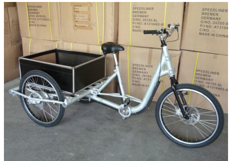
Abb. 1 Einsatz – und Nutzungsmöglichkeiten des Pedelecs 25