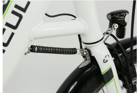
Abb. 10 Lenkungsdämpfer

Wird ein Pedelecs 25 auf einem Zweibeinständer abgestellt, hat in der Regel das Vorderrad keinen Kontakt zum Boden und schwebt frei. Ein Lenkungsdämpfer stabilisiert die Vordergabel in Fahrtrichtung beim Abstellen und verhindert damit ein unkontrolliertes Verdrehen des Lenkers. Somit wird das Beschädigen von z. B. elektrischen Leitungen und Bowdenzügen vermieden.