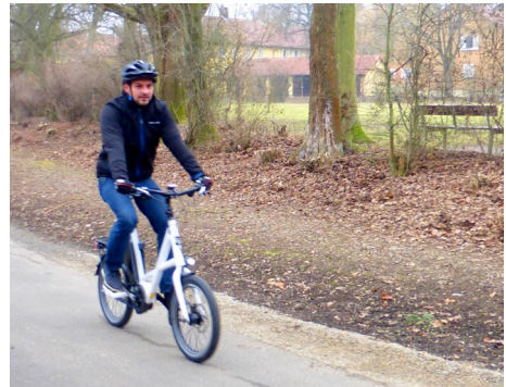
Abb. 16 Auf dem Weg zur Arbeit