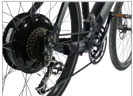
Abb. 6 Nabenmotor im Hinterrad

Der Motor befindet sich in der Nabe des Hinterrades. Diese Antriebsart bietet Traktionsvorteile am Berg. Bei hecklastiger Belastung neigt das Pedelec 25 zum „Flattern“.