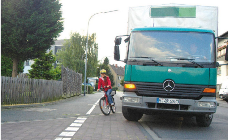
Abb. 16 Gefahr durch „Toten Winkel“