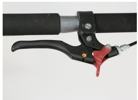
Abb. 12 Feststellbremse