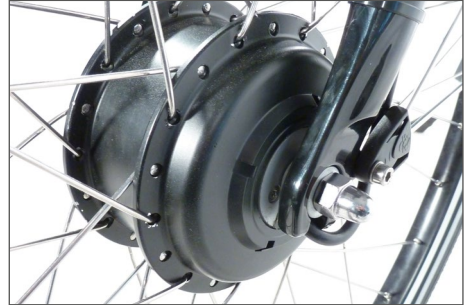
Abb. 4 Nabenmotor im Vorderrad

Der Motor befindet sich in der Nabe des Vorderrades. Die Kombination mit jeder Schaltung und Rücktrittbremse ist möglich. Nachteilig kann mangelnde Traktion (Griffigkeit) speziell beim Anfahren am Berg und in Kurven, auf rutschigem Untergrund sowie bei heckseitigem Schwerpunkt sein.