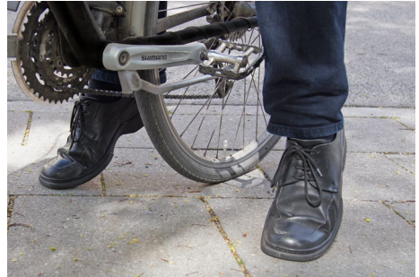
Abb. 13 Richtig eingestellte Sitzhöhe im Stand

Um eine angenehme, sichere und kraft-effiziente Sitzposition auf dem Pedelec 25 einnehmen zu können, ist die größtmögliche Anpassung des Pedelecs 25 an die jeweiligen individuellen Körpermaße des Benutzers erforderlich. Die benutzerabhängig erforderlichen Grundeinstellungen sollten vor Fahrtbeginn geprüft und gegebenenfalls angepasst werden. Dies wird durch die richtige Einstellung von Sattel und Lenker erreicht.