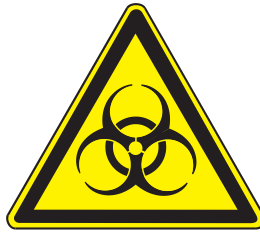
W16 Warnung vor Biogefährdung