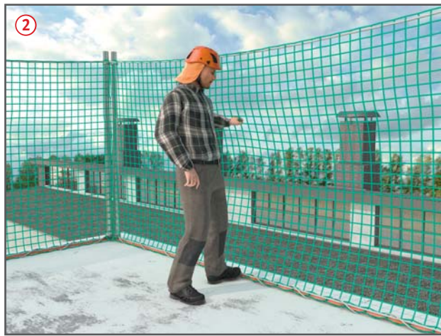
Randsicherung auf der Dachfläche