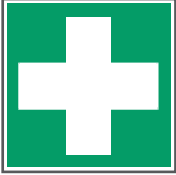
E003 Erste Hilfe