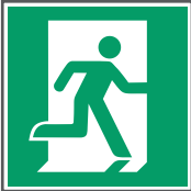
E002 Rettungsweg/ Notausgang (rechts)**