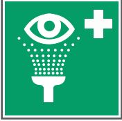
E011 Augenspül- einrichtung