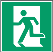
E001 Rettungsweg/ Notausgang (links)**