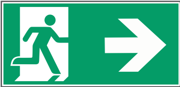
E002 Beispiele für Rettungsweg/Notausgang mit Zusatzzeichen (Richtungspfeil)