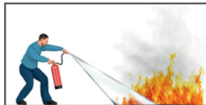
Flächenbrände vorn beginnend ablöschen