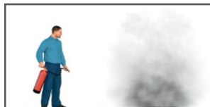
Vorsicht vor Wiederentzündung