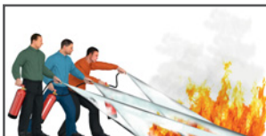
Genügend Löscher auf einmal einsetzen – nicht nacheinander