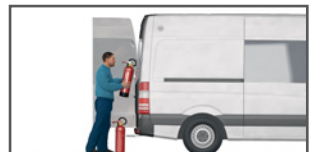
Eingesetzte Feuerlöscher nicht mehr aufhängen und neu füllen lassen