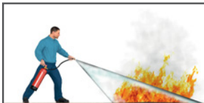
Feuer in Windrichtung angreifen